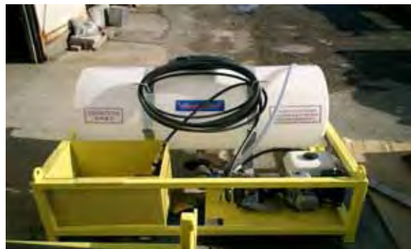
写真 - 3 . 給水タンクユニット

原型機の給水ポンプユニットは非常に騒音が大きいため、国内導入にあたり改良を行い、一般的な低騒音建設機械と同等のレベルまで低騒音化を図った。(写真 - 3)