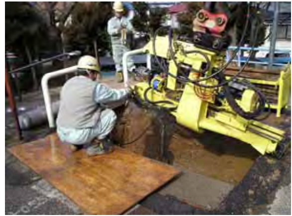
写真 - 13 . 清掃状況