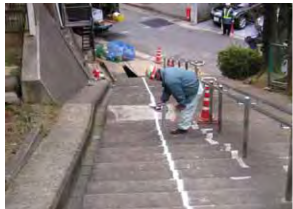
写真 - 9 . ロケーティング状況

立坑掘削が完了したら、推進作業の準備を行う。まず推進機をセットする。掘削機のバケットを取り外し、推進機を取り付ける。推進機本体の取り付け作業と、油圧ホースの接続作業時間は約5分程度である。推進機取り付けに伴う作業負荷は全くない。掘削に使用する掘削機を推進作業においても有効に活用できる。(写真 - 7 . 8)