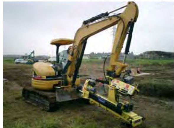
写真 - 1. フレックスドリル推進機