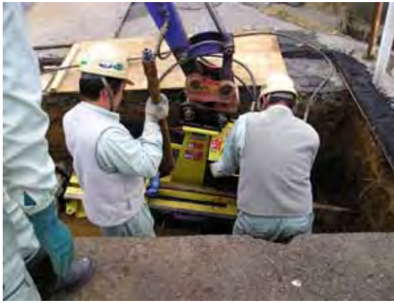
写真 - 10 . 推進作業状況