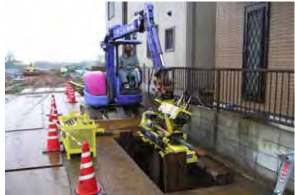
写真 - 8 . フレックスドリル機立坑設置状況