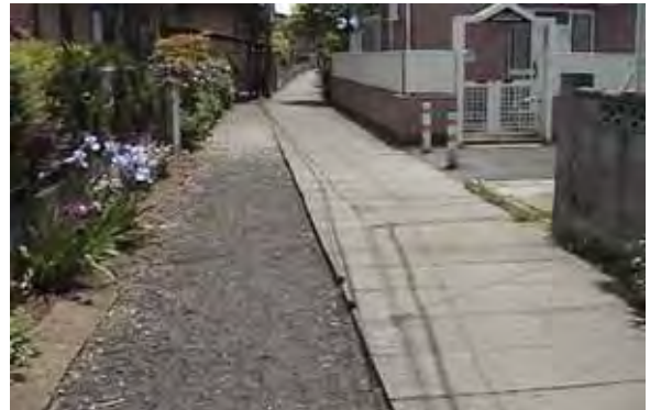
写真 - 18 . 現場写真

この現場は道路が狭いうえにダンプトラックの搬入が出来ない場所でガス用ポリエチレン管 50 A を 2.8 m 設置した現場である。(写真 - 18)