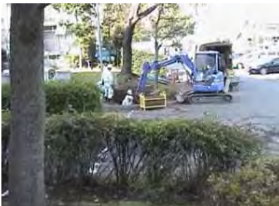
写真 - 17 . 施工状況

この現場は植栽部分に水道用ポリエチレン管 75 A を 4.0 m 設置した現場である。植栽の移設費用や復旧費用を大幅に削減した。(写真 - 17)