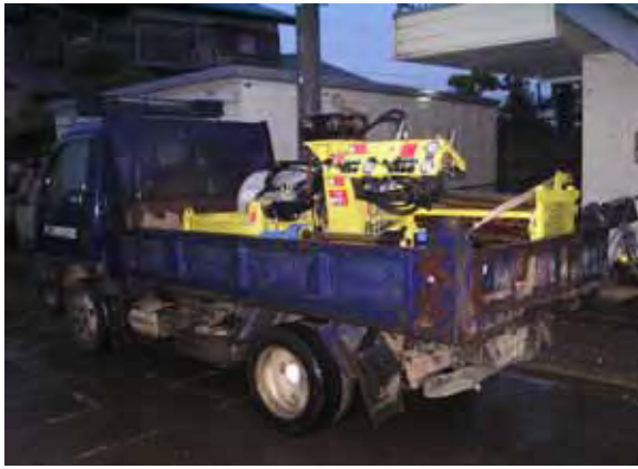
写真 - 5 . フレックスドリル機材車載状況