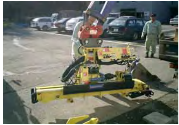
写真 - 7 . フレックスドリル機接続状況