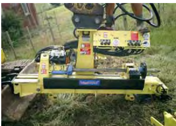
写真 - 2 . 推進機本体

推進機本体は掘削機のアームに取付ける構造で、国内の主なメーカーの掘削機に取付けることができる共通仕様である。大きさは長さ2 m、幅1 m程度。(写真 - 2)