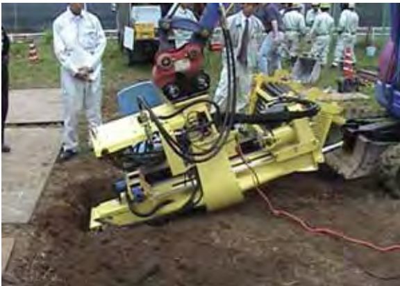
写真 - 6 . フレックスドリル地上設置状況

推進機本体を設置する立坑を掘削する。推進機本体がコンパクトなため、本体を立坑内に設置する場合、必要な大きさは長さ2.5m×幅1.5m程度である。立坑から推進せずに、地上から施工する場合は、作業に必要な舗装のハツリ作業等を行う。これらの掘削作業等は、掘削機を用いて行う。(写真 - 6)