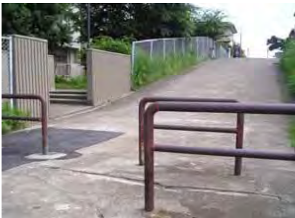
写真 - 16 . 現場写真

この現場はコンクリート舗装道路部分にガス用ポリエチレン管 200 A を 2.2 m 設置した現場である。(写真 - 16)