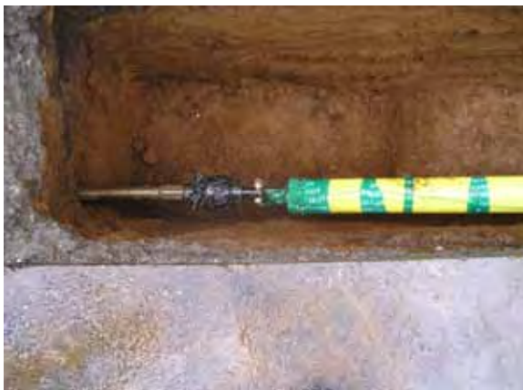
写真 - 11 . 配管接続状況

ロッドが到達坑に到達したら、バックリーマーを取り付け、引き込む配管をセットする。バックリーマーは、土質に合わせて様々な形状を選定できるが、当社は一般的な土質に適用する形状を中心に選定している。(写真 - 11 . 12)