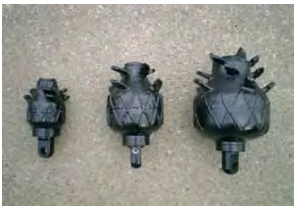
写真 - 12 . バックリーマー (左：100A用、中：150A用、右：200A用)

配管引き込み作業が完了したら、推進に使用する水を用いて推進機やロッドの清掃を行う。給水ポンプから供給される水を用いて、清掃する。(写真 - 13)