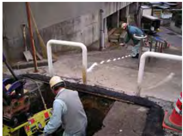
写真 - 14 . 施工状況

この現場はコンクリート階段部にガス用ポリエチレン管150Aを約30m敷設した現場である。大幅な作業時間の短縮と階段の復旧費用削減が図れた。(写真 - 14)