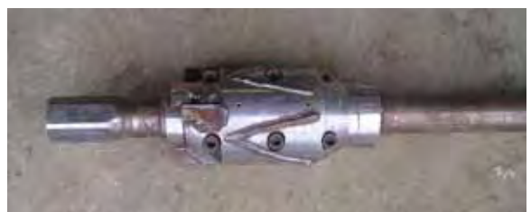
写真 - 19 . プレリーミング用治具