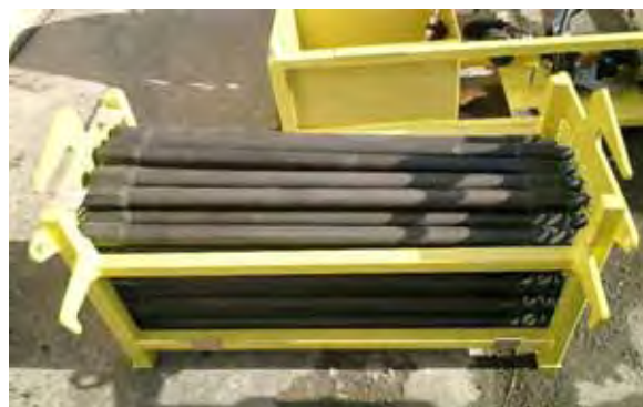
写真 - 4 . ロッドセット

1本約1 m、太さ45 mm。持ち運びに便利な大きさと長さである。50本を1セットとしてケースに収納。(写真 - 4)