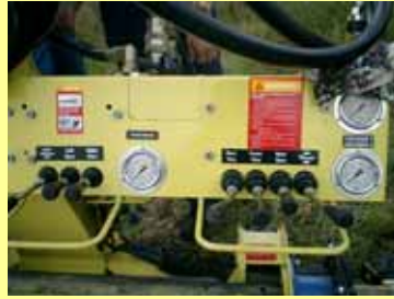
コントロールパネル