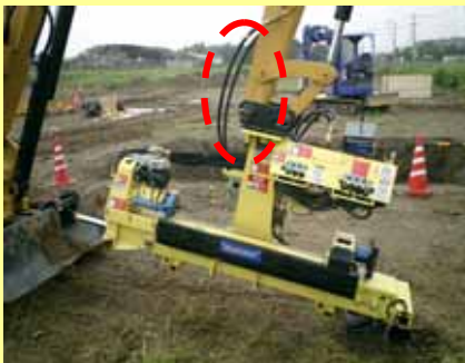
掘削機と油圧ホース接続