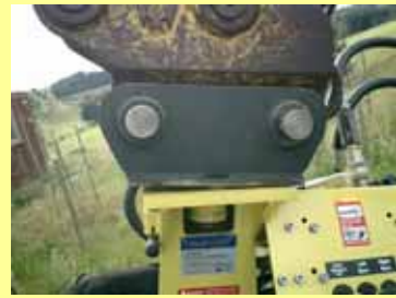
掘削機との接続部