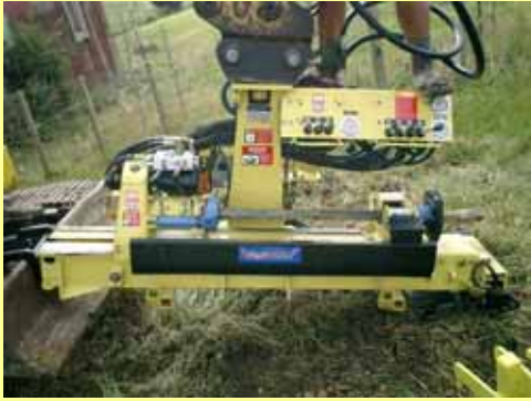
フレックスドリル本体