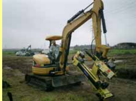
本体をアームに取付け