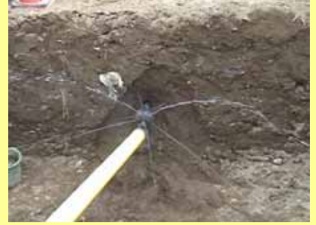
バックリーマーから水噴射